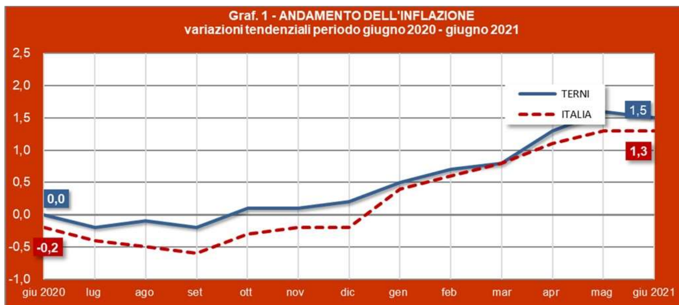
Grafico 1 - Andamento dell'inflazione.

Nel breve periodo, quindi rispetto al mese di maggio, la variazione congiunturale è stata positiva, ovvero in media i prezzi sono leggermente aumentati (+0,2%).