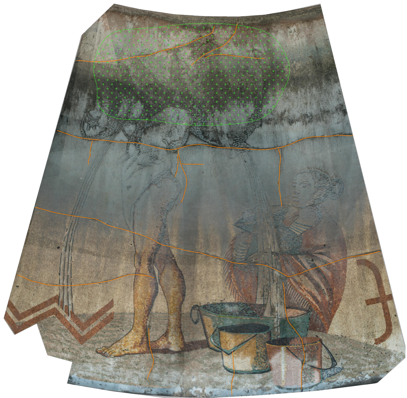
SCALA 1/25 0 0.50 1 m