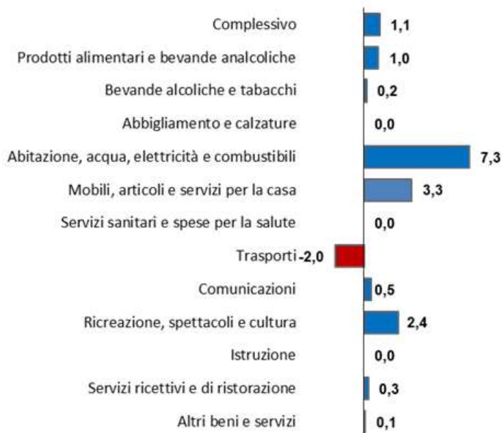
Graf. 2 - VARIAZIONI CONGIUNTURALI DELL'INDICE NIC luglio / agosto 2022