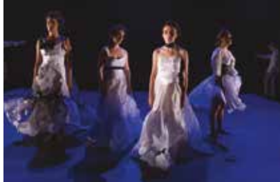
LA TRAGEDIA È FINITA, PLATONOV dall'11 al 14 ottobre