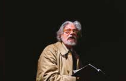
REGALO DI NATALE 10 e 11 novembre