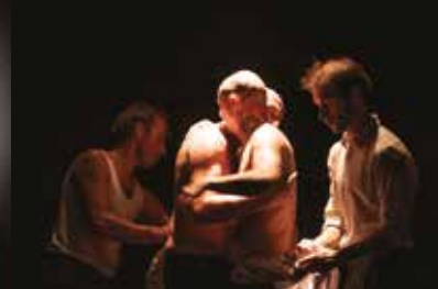
JUMP! 29 ottobre FUORI ABBONAMENTO