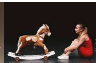
MIO PADRE NON È ANCORA NATO 17 gennaio FUORI ABBONAMENTO