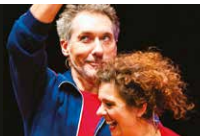
LA LEGGENDA DEL PALLAVOLISTA VOLANTE 14 e 15 dicembre