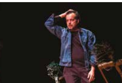
DEI FIGLI 3 e 4 marzo