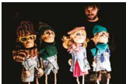
LA CLASSE 28 e 29 gennaio