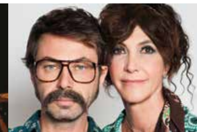
LA PARRUCCA 22 e 23 marzo