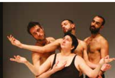
GRACES 27 e 28 dicembre