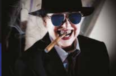
L'ANIMA BUONA DI SEZUAN 21 e 22 ottobre