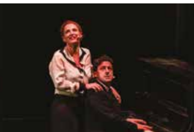
L'OMBRA DI TOTO' 18 e 19 febbraio